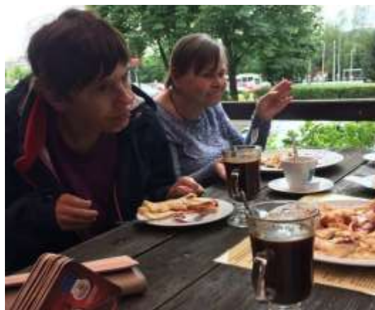
Posezení v kavárně