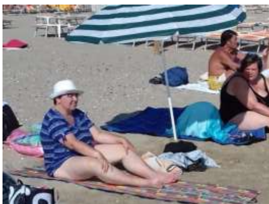
Rekreace v Chorvatsku