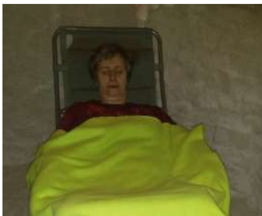
Návštěva solné jeskyně