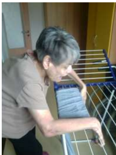
Běžný den v chráněném bydlení

Další klienti žijí v pěti garsoniérách jednoho bytového domu. Zde je klientům asistence k dispozici 24 hodin denně. Část z těchto klientů ji z důvodu vyššího stupně postižení využívá celodenně, další klienti tak intenzivní asistenci nepotřebují. Chodí do zaměstnání, stýkají se se svými přáteli a hledají různé aktivity mimo službu chráněné bydlení.